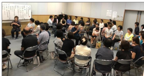
【ろう者の話をきこう】