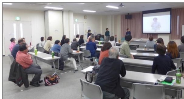
【なんぎな手話 DVD 学習会】

丹有地域班は、学習会の回数は少ないですが、どれも人気があり、毎回多くの方に参加いただいています。恒例の「ろう者の話を聞こう」では、各地域のろうの方にお話しいただき楽しく交流しています。今年度は通研会員に講師をお願いしてお菓子づくりにもチャレンジしました。完成したお菓子を食べながら和気あいあい、とても楽しく交流できました。